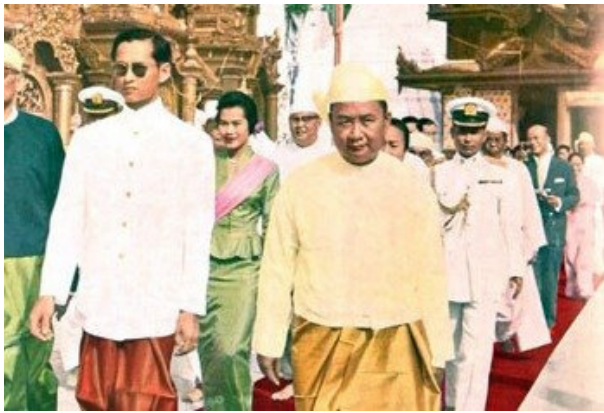
ထိုင်းဘုရင်ကြီး ဘူမိဘောနှင့်အတူ ရွှေတိဂုံစေတီတွင် တွေ့ရသော သမ္မတမန်းဝင်းမောင်

ပါဝါဘဏ္ဍာရေးမင်းကြီးရုံးမှာ အလုပ်လုပ်စဉ် အကောက်ခွန်ဌာနမှာ အလုပ် နှစ်ကြိမ် လျှောက်ဖူးပါတယ်။ ပထမအကြိမ်ဟာ ယာဖြတ်အလုပ် ဖြစ်ပါတယ်။ လက်ထောက် အကောက်ခွန်မင်းကြီး (ရာဖြတ် ဆိုင်ရာ) နှင့် လူကိုယ်တိုင် သွားရောက် အစစ်ဆေး မေးမြန်းခံရပါတယ်။ လက်ထောက်မင်းကြီးဟာ သူ စစ်ဆေးမေးမြန်းပြီး သူကြိုက်နှစ်သက်တဲ့လူတွေ နောက်ဆုံး အစစ်ဆေးမေးမြန်းခံရန် မင်းကြီးထံ နာမည်တင်ပြပါတယ်။ ပါဝါအနေနဲ့ ပြုတ်ကျန်ရစ်ခဲ့ပါတယ်။ အဲဒီတုန်းက လက်ထောက်မင်းကြီးဟာ မြန်မာအမျိုးသား အိုင်စီအက် (စ) ဖြစ်ပါတယ်။